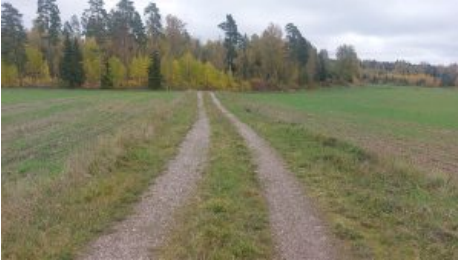
Tie ennen käänköpaikkaa