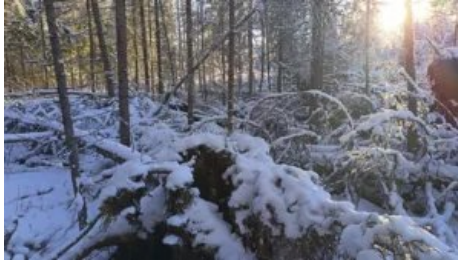
Kuvio 2 reunapuusto