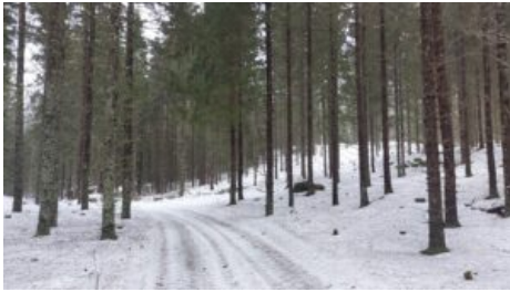
Ohrapäätie kuvion 12 halki