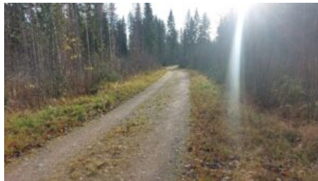
tie tilan kohdalla