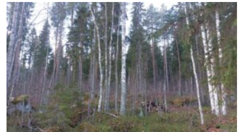
Tonttikuvio rannalta päin