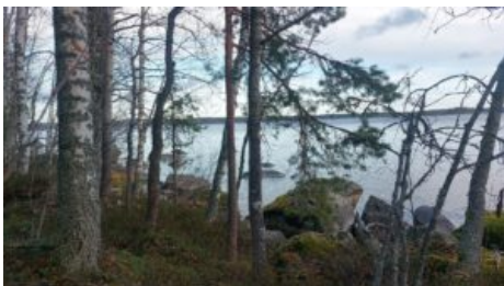
8 (rakennuspaikan rantaa)