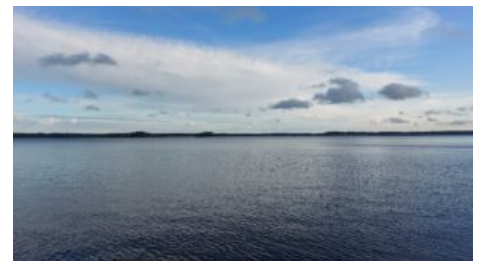
Lievestuore rakennuspaikan rantakiveltä kuvattuna