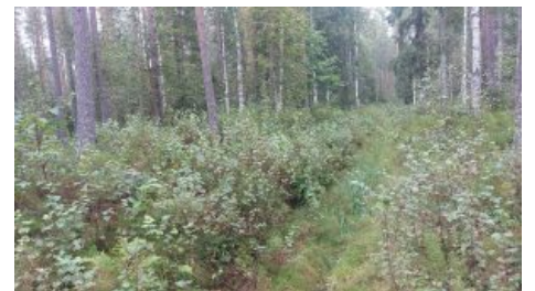
6 itäosan ojaa