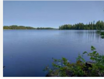
Näkymä järvelle rannasta