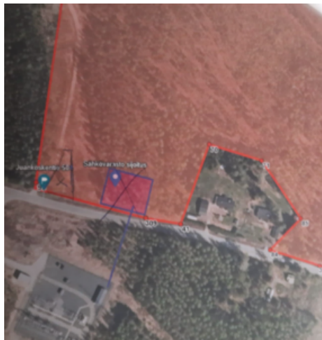
Akkuvaraston mahdollinen sijainti, pyyki 95