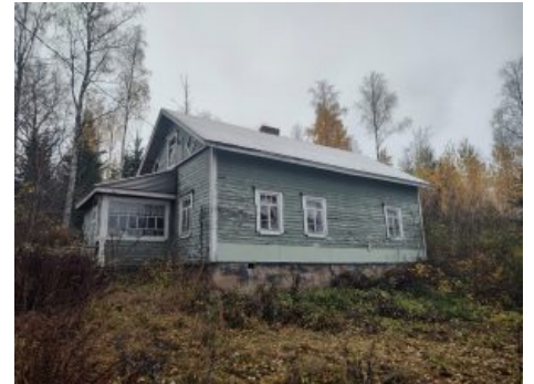
Rautjärvi vihreä päärakennus