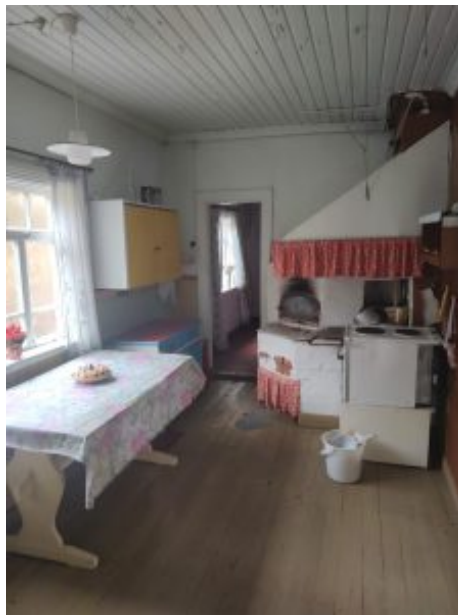
Rautjärvi vihreän rakennuksen keittiö